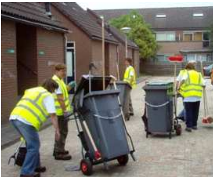
De vrijwilligers in actie.

Maandag 11 juni is de vrijwilligersgroep “de bezem erdoor” voor het eerst in de wijk aan de slag gegaan. De week ervoor hadden de vrijwilligers al kennis met elkaar gemaakt op het kantoor van Portaal. Daarna zijn we met zijn allen door de wijk gegaan om te kijken wat er te doen is.